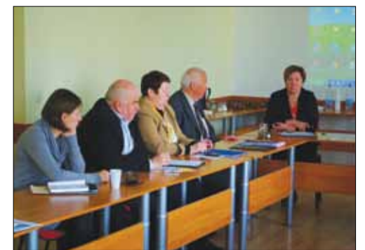
2013 m. balandžio 30 d., LPSK darbuotojams Socialinės partnerystės mokymai surengti Vilniuje.