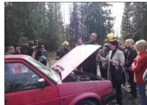
Gaisrinės saugos mokymuose dalyvavo per 400 degalinių darbuotojų.

Lietuvos paslaugų sferos darbuotojų profesinės sąjungos informacija