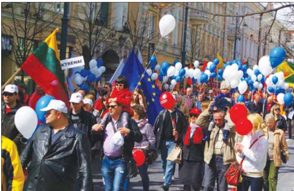
Šventinėje Tarptautinės darbo žmonių vienybės dienos demonstracijoje netrūko šypsenu ir geros nuotaikos.

Eisenos priekyje žygiavo valstybinis pučiamųjų orkestras „Trimitas“ ir šokėjos. Renginyje dalyvavo Socialdemokratų partijai priklausantys LR Seimo, Europos Parlamento nariai.