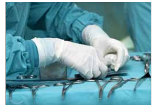
Profesinės sąjungos duomenimis, dėl kasdienio kontakto su biologiniais skysčiais ir darbo su aštriais instrumentais sąlygotus susirgimus medikai išsigydo jų neviešindami.

Europos Sąjungos narės, tarp jų ir Lietuva, nuo 2013 m. gegužės 11 d. turi būti įgyvendinusios Europos Sąjungos Tarybos priimtą direktyvą 2010/32/ES. Šios direktyvos tikslas – kurti kuo saugesnę darbo aplinką, užkertant kelią susižeidimams, kuriuos darbuotojai patiria dėl visų aštrių medicininių instrumentų naudojimo, ir maksimaliai apsaugoti darbuotojus, kuriems kykla ši rizika.