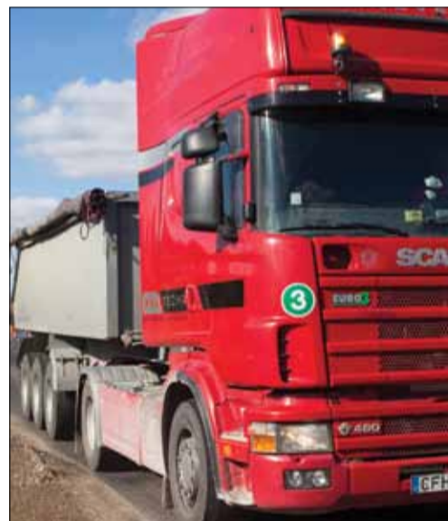
Darbą vairuotojams tarptautiniais maršrutais viešojoje erdvėje siūlo daugybė įmonių, tačiau Darbo birža tokios informacijos teigia neturinti.