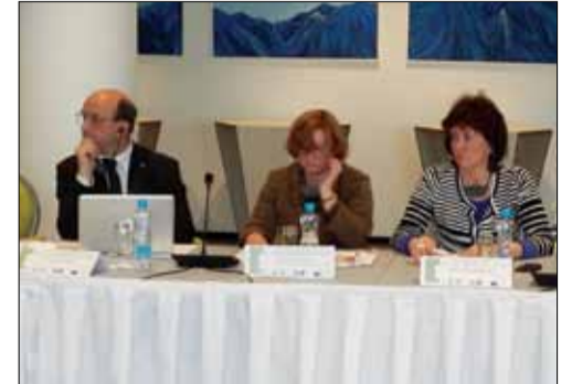
Savo patirtimi pasidalijo Belgijos, Italijos, Olandijos ir Lietuvos specialistai.

Šio tikslo reikia siekti ne vien tik dėl galimų vėžinių susirgimų rizikos: dulkės plačiąja prasme kelia pavojų sveikatai, blogai veikia darbuotojų savijautą ir, be to, gali pakenkti darbo efektyvumui ir gaminių kokybei.