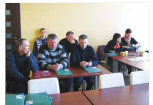
2013 m. kovo 27 d., įvyko Socialinės partnerystės mokymai Mažeikiuose.

LPSK struktūroje esančios ir projekte dalyvaujančios organizacijos iš AB „Snaigė“, VĮ Ignalinos atominė elektrinė, AB „Vilniaus energija“, AB „Kauno grūdai“, UAB „Delita“, VĮ Kauno miškų urėdija, VĮ Dubravos eksperimentinė-mokomoji miškų urėdija, VĮ Radviliškio miškų urėdija, Mažeikių rajono savivaldybės, Mažeikių rajono vaikų ir našlaičių globos namų, VĮ Mažeikių greitosios medicinos pagalbos centro, UAB „Mažeikių komunalinis ūkis“, UAB „Mažeikių vandenys“, Utenos rajono savivaldybės, Utenos socialinės globos namų, VšĮ Utenos ligoninė, Ukmergės rajono vartotojų kooperatyvo, siekia pasirašyti 17 įmonių kolektyvinių sutarčių, įmonėse įsteigti 16 darbuotojų saugos ir sveikatos komitetų. Panevėžio apskrities valstybinės mokesčių inspekcijos ir Panevėžio profesinių sąjungų koordinacinės tarybos planuoja steigti dvišalę tarybą.