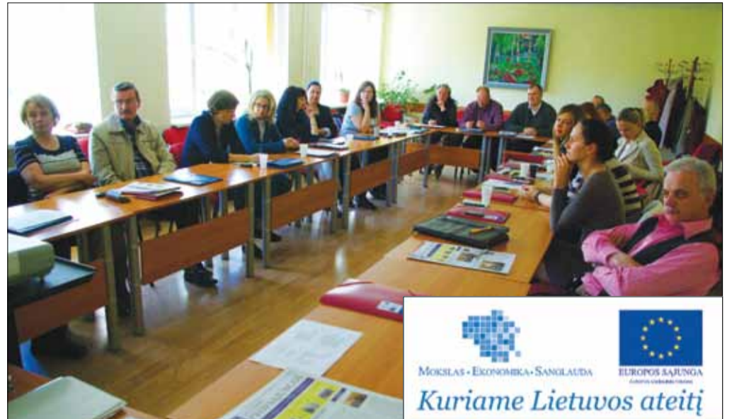
Kolektyvinių sutarčių mokymai Vilniaus energijos atstovams 2013 m. gegužės 6 d.

Taigi, kokios šakinės sutartys galėtų būti Lietuvoje, aiškina teorija – LR darbo kodeksas.