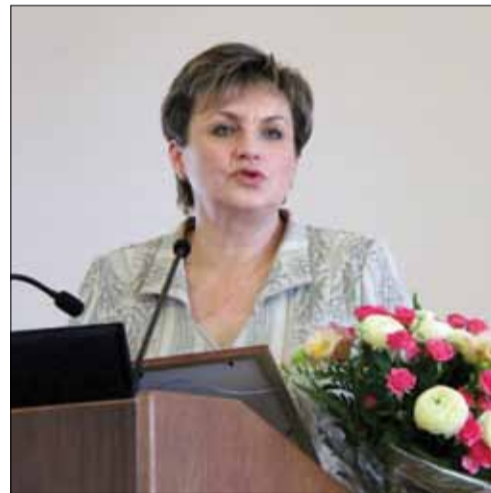
Šventės dalyvės ir dalyvius pasveikino LR Seimo sveikatos reikalų komiteto pirmininkė Dangutė Mikutienė.