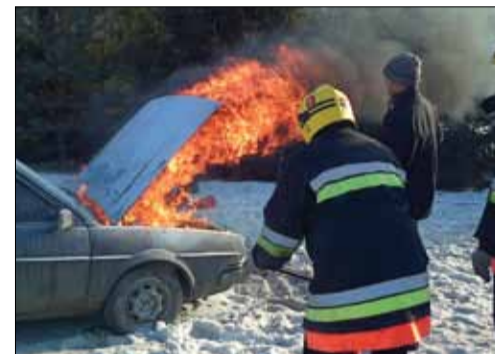
Mokymų dalyviai praktikavosi gesinant degantį automobilį.