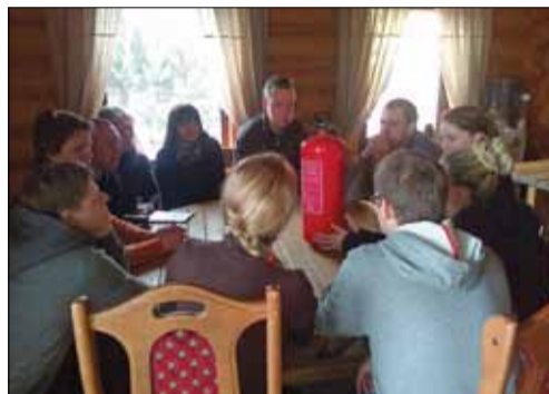
Dalyviai analizavo situacijas ir diskutavo, kokius sprendimus reikėtų priimti, kad išvengtume nelaimingų įvykių.