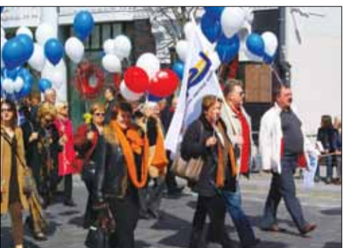
Šventinėje demonstracijoje dalyvavo - Lietuvos kultūros darbuotojų profsąjungų federacijos, Lengvosios pramonės profesinės sąjungos, Maistinių profesinės sąjungos, Pramonės profesinių sąjungų federacijos, Radioelektronikos pramonės profsąjungų organizacijų, Ryšių darbuotojų profesinės sąjungos, Statybininkų profesinės sąjungos, Sveikatos apsaugos darbuotojų profesinės sąjungos, Švietimo ir mokslo profesinių sąjungų federacijos, Valstybės tarnautojų, biudžetinių ir viešųjų įstaigų darbuotojų profesinių sąjungų, Teisėsaugos pareigūnų federacijos, Žemės ūkio darbuotojų profesinių sąjungų federacijos, asociacijos „LPSK Jaunimas“ atstovai, LPSK sekretoriato darbuotojai.