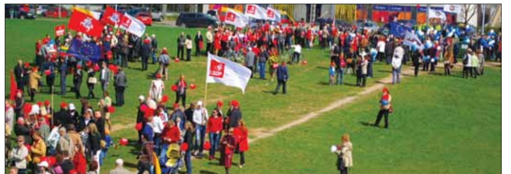
Renginyje dalyvavo Socialdemokratų partijai priklausantys LR Seimo, Europos Parlamento nariai.