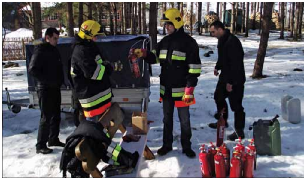
Po tokių realių pratybų bus saugiau imtis iniciatyvos ir pagelbėti gesinant rūkstantį automobilį degalinių teritorijoje ar kelyje.