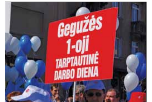
1889 metais Paryžiaus II tarptautinis kongresas paskelbė gegužės 1-ąją viso pasaulio Darbininkų solidarumo dieną.