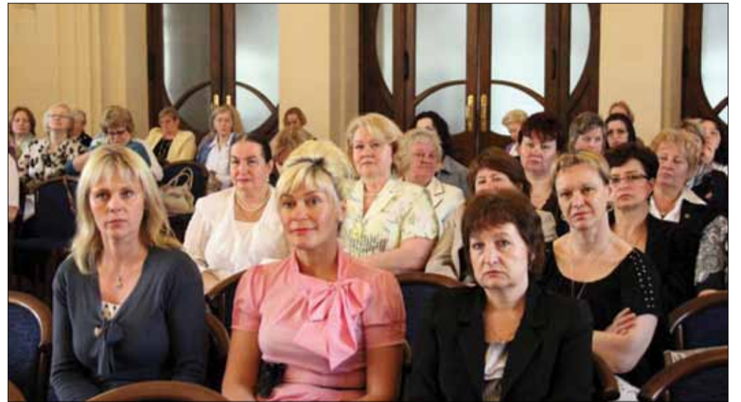
Sunkiausiai dirbančius šalies slaugytojus, nudžiugino Konstitucinis Teismas, kurio sprendimu pripažinta, kad didelės psichinės ir emocinės įtampos sąlygomis dirbantiems medikams privalu grąžinti ilgesnes atostogas ir sutrumpinti darbo savaitę, nes buvusi LR Vyriausybė jas panaikino neteisėtai.